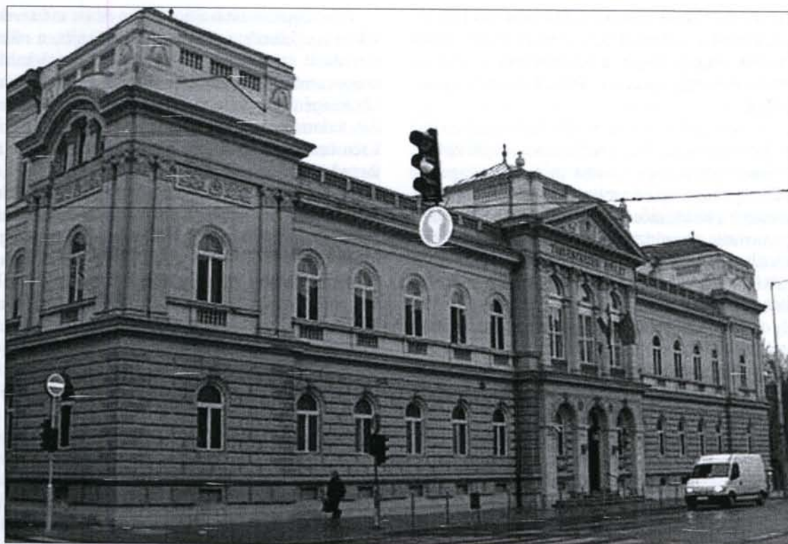
A győri Törvénykezési Palota, a kir. ítélőtábla korábbi székhelye